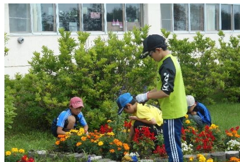
PTAで植えた花壇の花を水やり、草抜きと手入れしてきました。

地域・保護者の皆さまには、今学期も本校の教育活動の様々な場面においてご理解とご支援をいただきましたことにお礼申し上げます。おかげさまで、本校の教育活動も、多くの成果をあげることができました。今後も、ともに子どもたちを育てていくために、皆さまのお力をお貸しください。