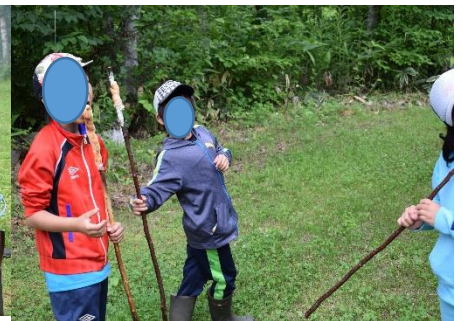
焼き上がったパンをバクリ！