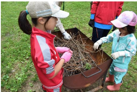
集めた枝でかまどづくりをしました。

かまどを組み、火をおこしました。枯れ枝が炭になるまでみんなで協力して燃やし、その後はお楽しみのパンを焼きました。前日に5、6年生で作った生地を、縦割り班で助け合いながら、木に巻き付け焼きました。この時に、5、6年生が下級生にいていないに教えている姿に、指導してくれたはぐく一むの先生達が、とても感心していました。私も誇らしい気持ちになりました。