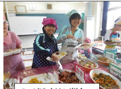
5, 6年生バイキング給食