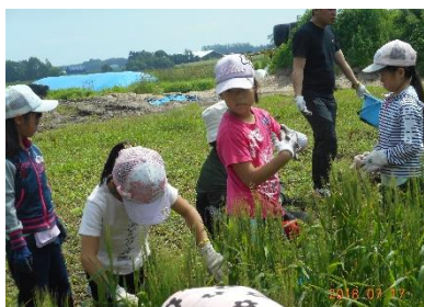
全校児童で力をあわせてポロシリ農園の草取り