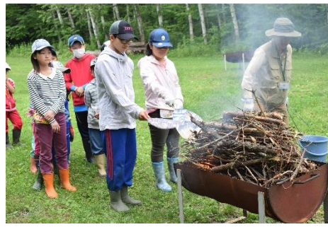
白樺の皮を発火させて、火を燃やします。