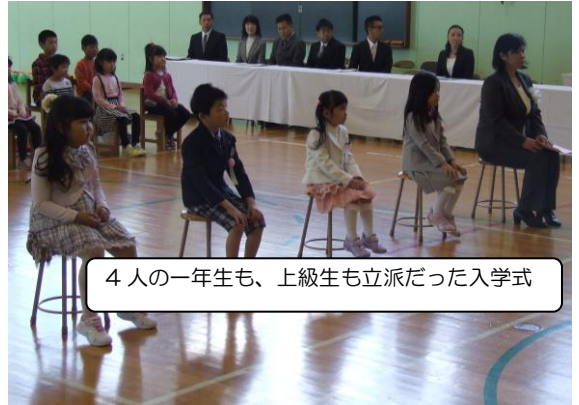
4人の一年生も、上級生も立派だった入学式

平成29年度は、教職員12名と図書専門員の、スクールバス運転手のとを加えて、総勢15名のスタッフとなりました。今年は重点目標を「心を耕し、心をつなげ、未来に向かってススム・ヒロノ～たくましく学びに向かう力の育成」と設定し、「笑顔であいさつ」を合い言葉に、あたたかく心がつながる学校を目指します。なによりも、子どもたちの健やかな成長のためになることを考え、ご家庭や地域の皆様と力を合わせて、充実した教育活動に取り組んでいく所存です。今年度も広野小学校の教育活動の推進に、一層のお力添えを賜りますようお願いいたします。