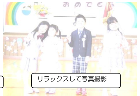
リラックスして写真撮影