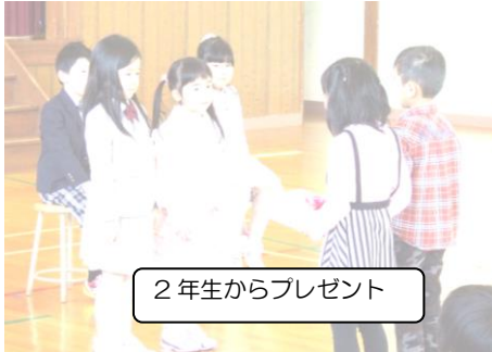
2年生からプレゼント